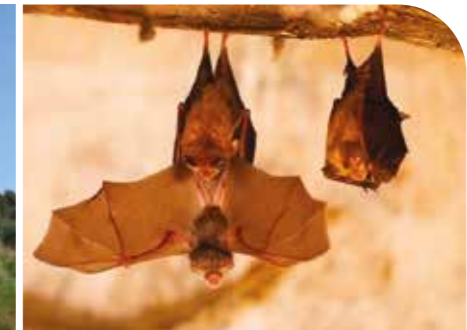
Mères Petits rhinolophes et leurs petits

Le Groupe Chiroptères de Provence a obtenu une subvention France Relance financée par l'UE pour restaurer l'entrée de la petite mine du Groseau et d'un cabanon sur le territoire de Malaucène afin de les dédier aux chauves-souris et dans notre cas au « petit rhinolophe » espèce endémique au Groseau. Les travaux ont été réalisés en 2023. Les chiroptères sont des mammifères