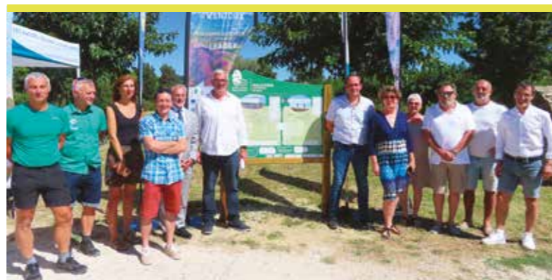
Installation d'un panneau sur le site des Palivettes. Projet financé dans le cadre du programme Européen Leader.