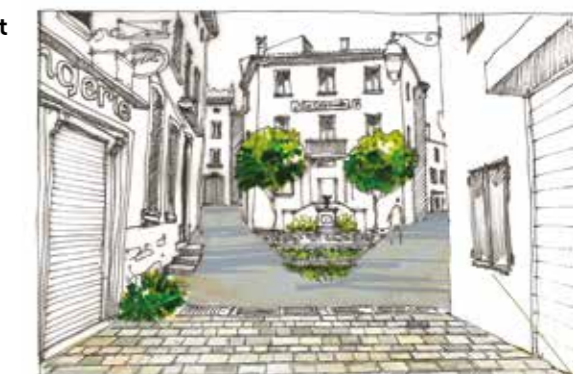
Atelier Skala et Agence Paysages

Cette étude doit aboutir à une première phase de travaux dans la Grand Rue et sur les places dès 2024, et le montage des différents dossiers de demande de subventions auprès de l'État, du Fonds Vert et de la Région Sud est en cours par les services.