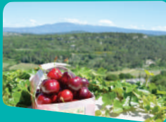
La délicieuse cerise de Venasque.

La cerise des Monts de Venasque , leader de la cerise haut de gamme. Appelée aussi diamant rouge pour sa saveur juteuse, sa forme charnue et son goût craquant, on la trouve dès le mois de juin sur les marchés et chez les producteurs locaux.