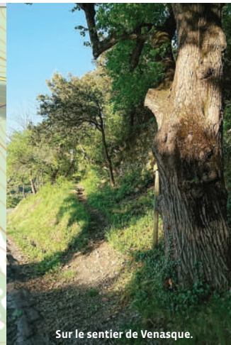
Sur le sentier de Venasque.