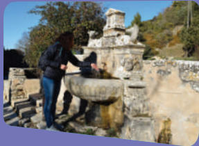
L'ermitage de Saint-Gens.

Petite excursion au village perché du Beucet, village de crèche . Au pied du rocher, une vallée encaissée conduit à l' ermitage de Saint Gens , lieu de pèlerinage célébré chaque année en mai.