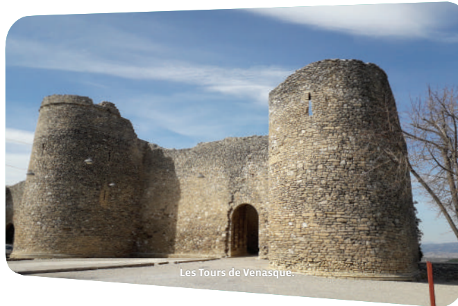
Les Tours de Venasque.

Les ruines de la ferme de la Pérégrine (entre les points 2 et 3)