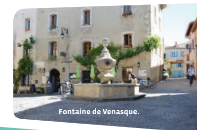
Fontaine de Venasque.

6 A la sortie des gorges, dépasser le panonceau « Fonds de Nesque - 221 m », et 150 m plus loin, remonter à droite par la Combe du Diable balisée en jaune. La montée est raide et le sentier escarpé : prudence ! Ce sentier balisé s'adoucit pour vous ramener au parking.