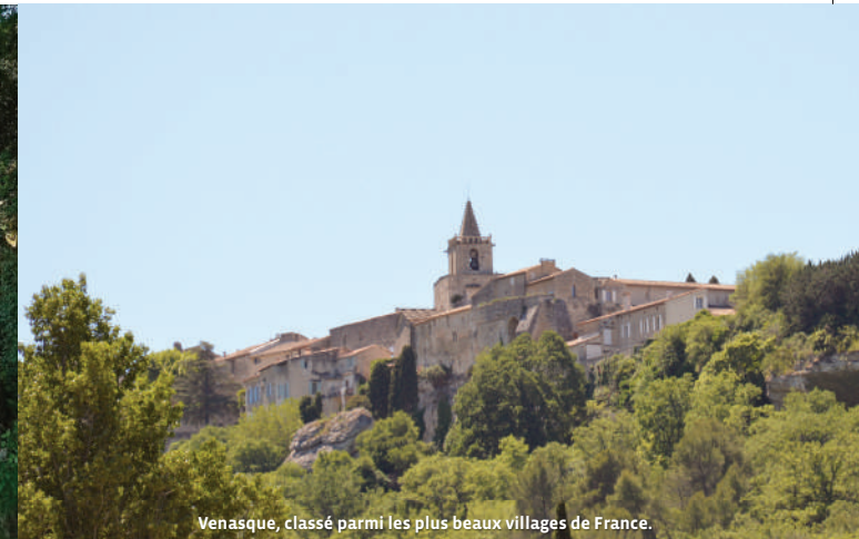
Venasque, classé parmi les plus beaux villages de France.

Balilage : PR (jaune) / GRP (jaune et rouge)