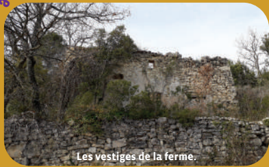
Les vestiges de la ferme.

Venasque , classé plus beau village de France et son Baptistère.